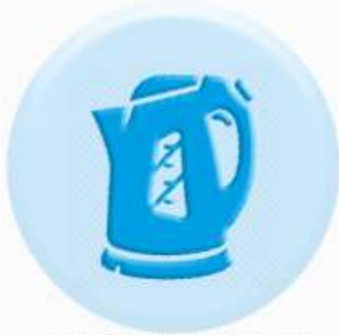
КНОПКИ БЫТОВЫХ ПРИБОРОВ