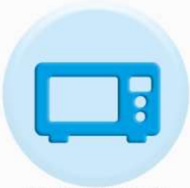
ПАНЕЛИ БЫТОВОЙ ТЕХНИКИ