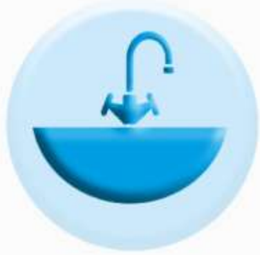
РАКОВИНЫ И СМЕСИТЕЛИ