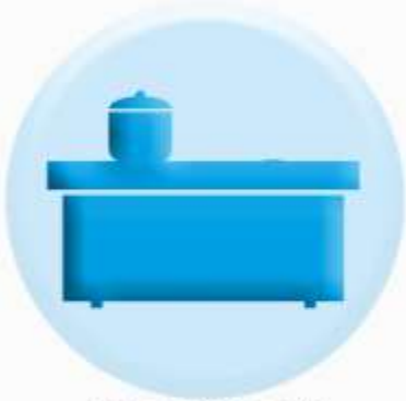
ПОВЕРХНОСТИ СТОЛЕШНИЦ, ПОЛОК