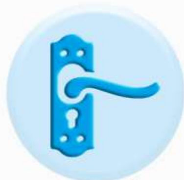
РУЧКИ ДВЕРЕЙ И ШКАФОВ

ТО, К ЧЕМУ МЫ ПРИКАСАЕМСЯ ЧАЩЕ ВСЕГО ДОЛЖНО БЫТЬ ЧИСТЫМ