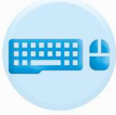
КЛАВИАТУРА ОРГТЕХНИКИ И МЫШКА